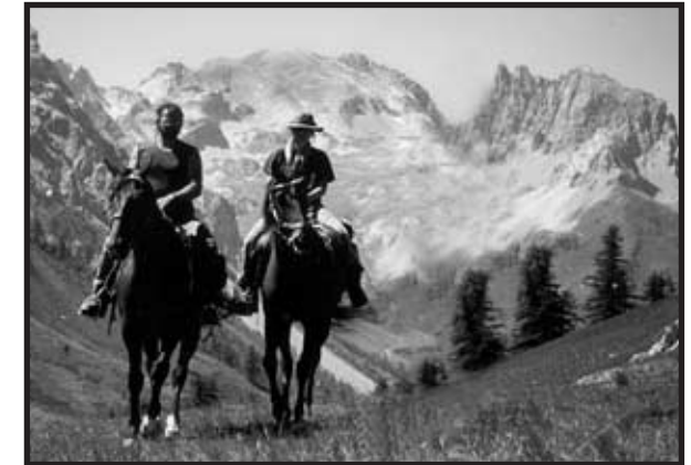
Cavalieri dell'Alpitrek al col di Thures. Sullo sfondo il Monte Thabor

Quando l'agnello aperse il settimo sigillo, nel cielo si fece un silenzio di circa mezz'ora, e vidi sette angeli davanti a Dio e furono loro date sette trombe.