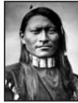
Pantera Rossa Armata Scout Cheyenne