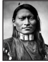
Pantera Rossa Armata Scout Cheyenne

Histoire rapportée par don Masset, prêtre de Melezet à Mauro en 1956.