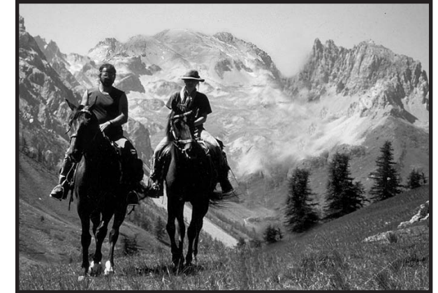
Les cavaliers Alpitrek au col Thures: Au fond le Mont Thabor

Il vit sept anges devant Dieu et il leur fut donné sept trombes.